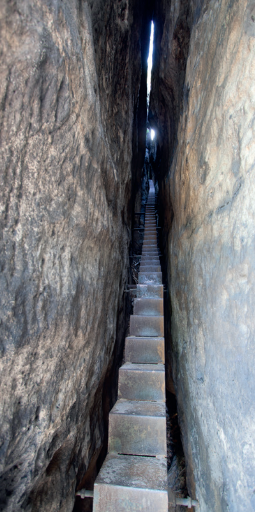
Kruipend over de rotsen van de Honigsteinrücken.