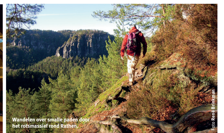
Wandelen over smalle paden door het rotsmassief rond Rathen.