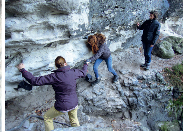
Foto links De Himmelsleiter brengt je boven op de rotsen van Kuhstall. Foto boven We helpen elkaar bij smalle rotsbandjes. Foto middenonder De monnik op de Mönchstein is een windwijzer. Foto rechtsboven Aanwijzing naar de rotsdoorsteek. Foto rechtsonder Korte klimpassage in de Rahmhanke Stiege.